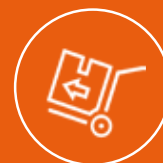
Logistica & Industriale