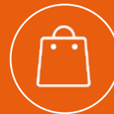
Retail & GDO